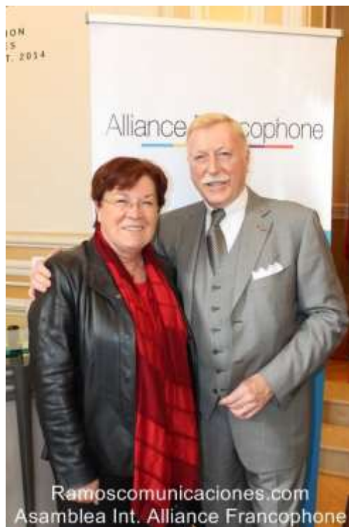
Michèle André – Sénatrice Présidente de l'Union Parlementaire Internationale - Section France