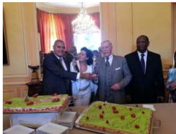
A l'occasion de cette Assemblée Internationale, le Président de l'Alliance Francophone a reçu le Prix Ramos Communication pour son action humanitaire internationale