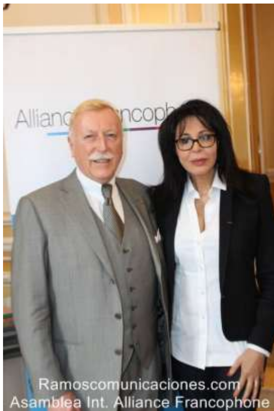
Yamina Benguigui – Ancien Ministre de la Francophonie