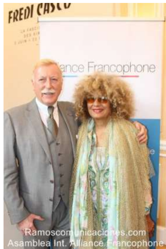
Le Président en compagnie de « Owanto » célèbre artiste peintre et sculpteur du Gabon