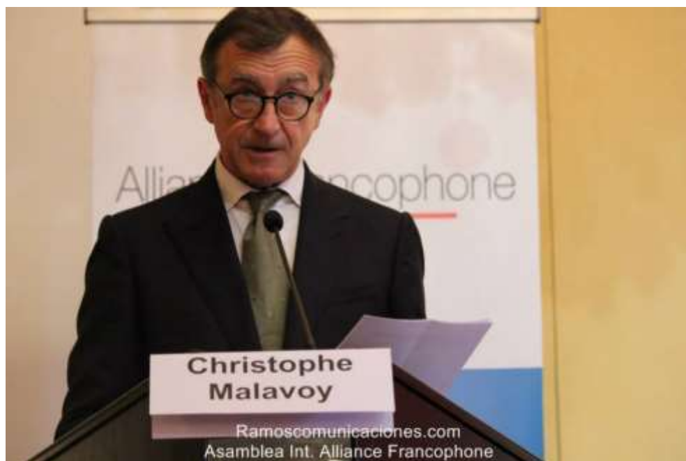
Christophe Malavoy au cours de son intervention