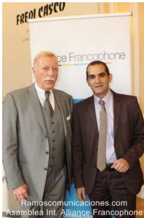
Pouria Amirshahi – Commission des Affaires Etrangères de l'Assemblée Nationale Française.