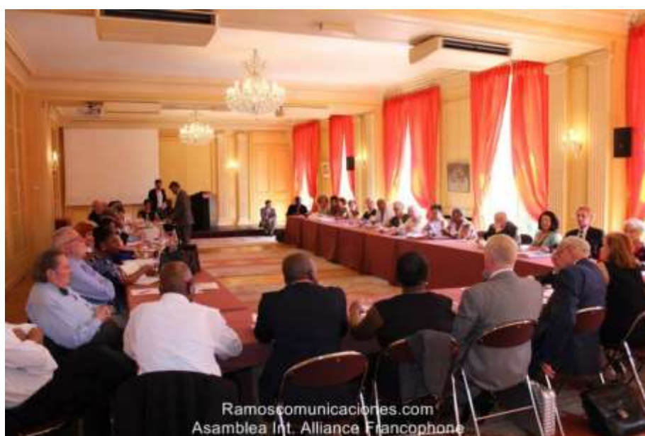
Vue de l'Assemblée constitutive du Conseil d'Administration