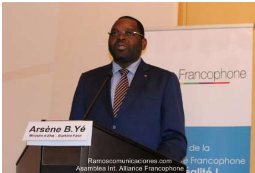
Le Ministre d'Etat Arsène Bongnessan Yé du Burkina Faso, pendant son intervention.