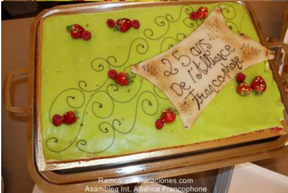
L'Alliance Francophone : Une jeune fille de 25 ans déjà !