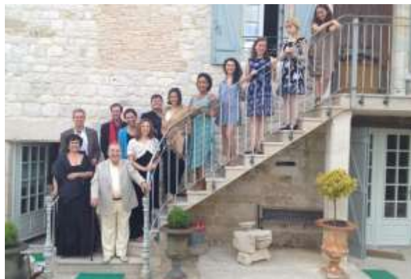
Les stagiaires 2013 et Michel Sénéchal (en costume clair)

En partenariat avec l'Alliance Francophone, « Art du chant Français » propose un concert exceptionnel d'opéras (grands airs et duos de Carmen, des Pêcheurs de perles, de Faust, etc.) sous le patronage et en présence de Michel Sénéchal, le vendredi 20 juin 2014 à 20h30 au Manoir Des Jouandis (Sainte-Sabine-Born).